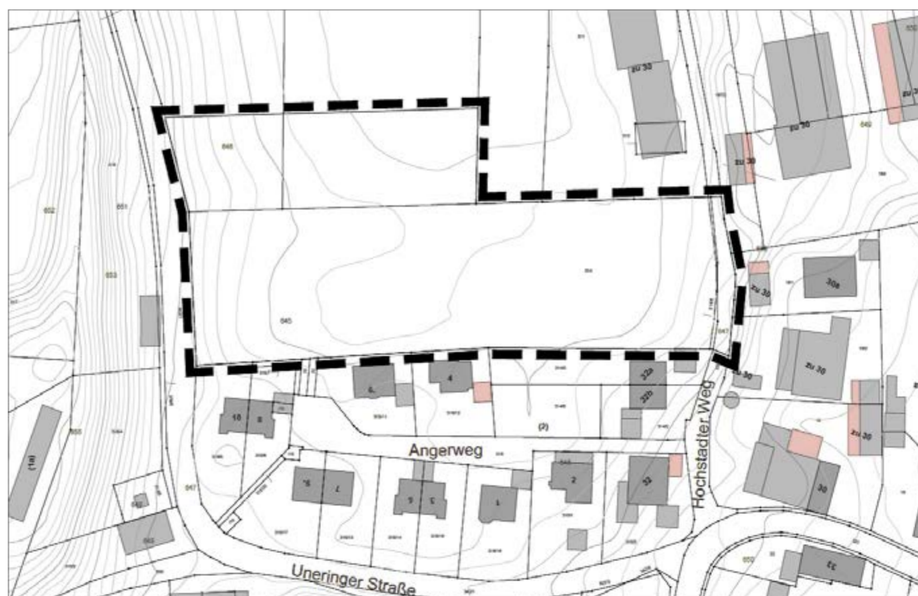
Planungsumgriff – Bebauungsplan Nr. 7207

Auf die Vorschriften des § 44 Abs. 3 Satz 1 und 2 des Baugesetzbuches (BauGB) über die Geltendmachung etwaiger Entschädigungsansprüche