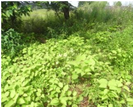
Neuausschlag nach Mahd

Möglichkeit. Da die Verwendung von Chemikalien in Feuchtgebieten, entlang von Gewässern und im Wald verboten ist, ist ihr Einsatz nur in bestimmten Fällen möglich. Man braucht dafür außerdem eine Ausnahmegenehmigung durch das zuständige Amt für Landwirtschaft sowie einen Sachkundenachweis.