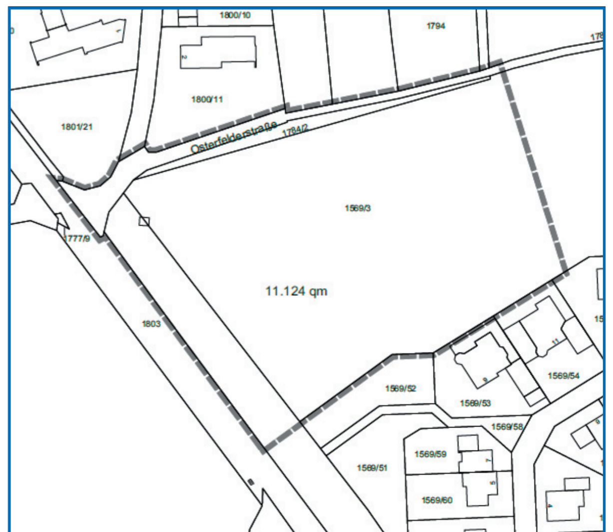
Geltungsbereich des Bebauungsplanes Nr. 97 „Wohnzentrum Osterfeld“

Gemeinde Berg – R. Monn, 1. Bürgermeister