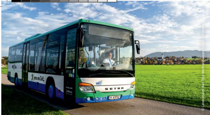
© Landratsamt Bad Tölz-Wolfratshausen Simon Schneider